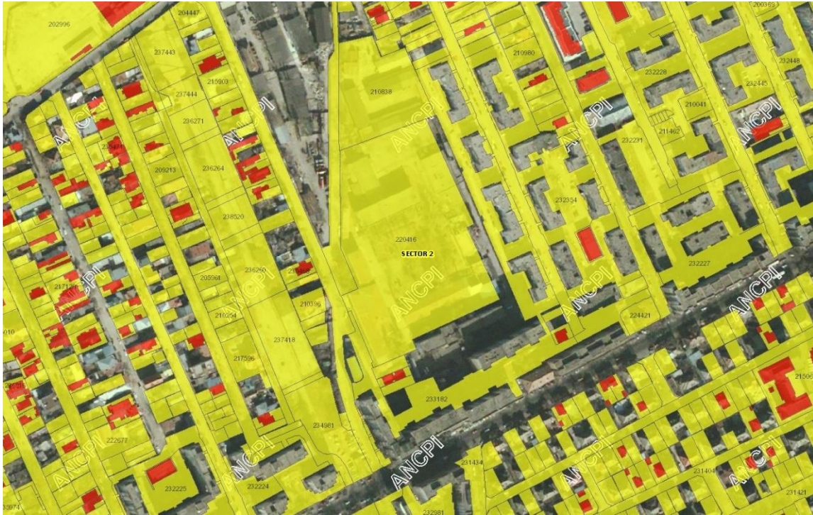
Extras din încadrare in ANCPi, imobile E-terra